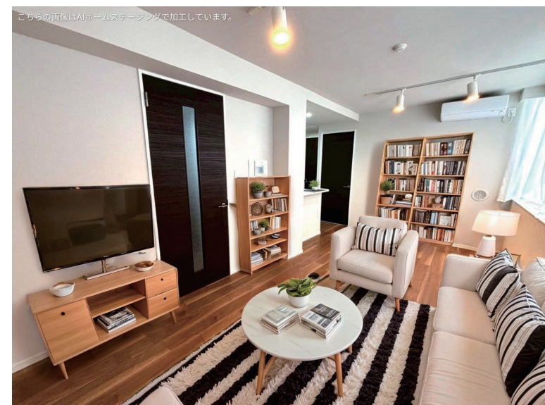
※リビングをイメージ