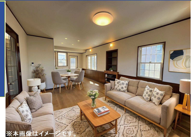
※本画像はイメージです。