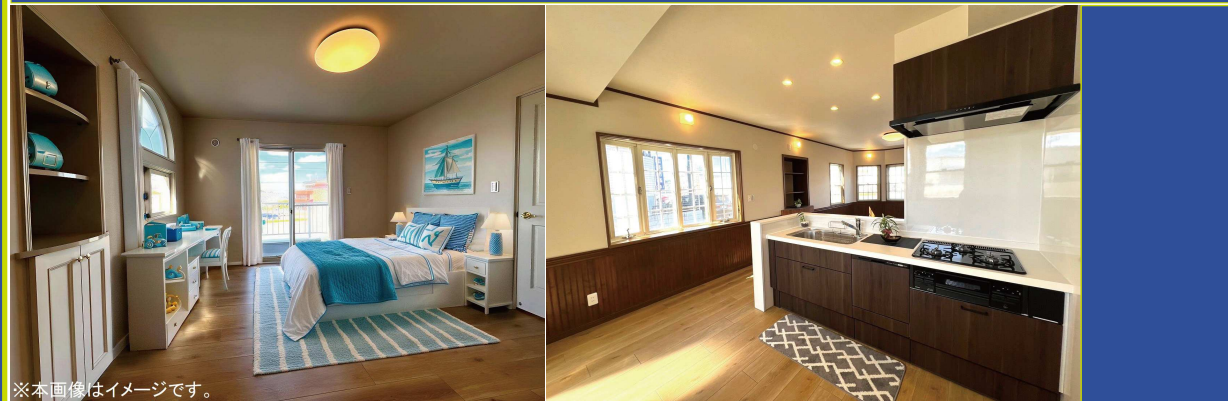
※本画像はイメージです。