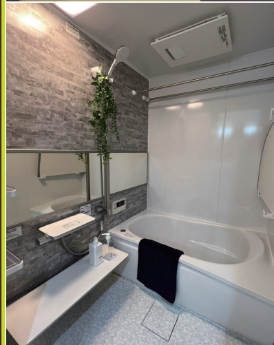
701号室 【3LDK 66.80㎡】