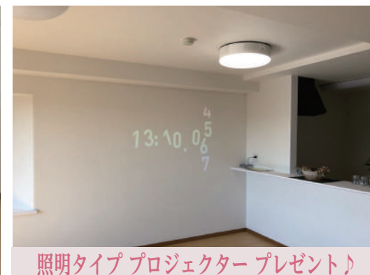
照明タイププロジェクタープレゼント♪