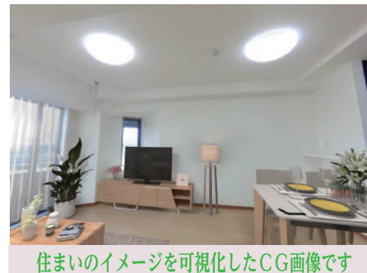
住まいのイメージを可視化したCG画像です